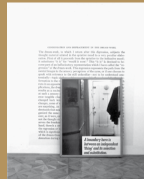
Joseph Kosuth, »O.&A./FID!(TO I. K. AND G. F.)«, Siebdruck, Fotografie gerahmt, 1987.